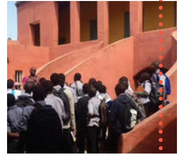
Maison des Esclaves, Senegal