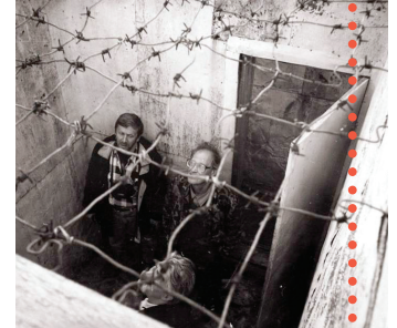
Museo Gulag en Perm-36, Rusia