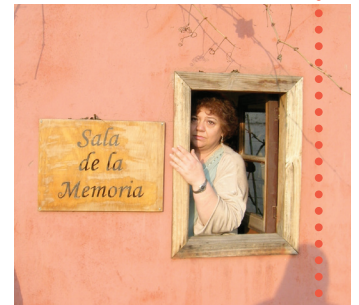
Parque por la Paz Villa Grimaldi, Chile