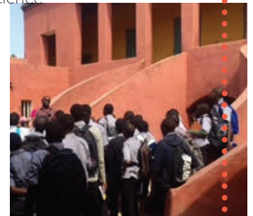
Maison des Esclaves, Senegal