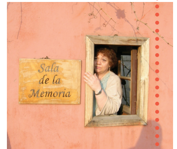
Parque por la Paz Villa Grimaldi, Chile