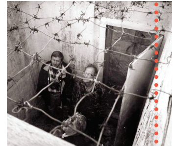
Museo Gulag en Perm-36, Rusia