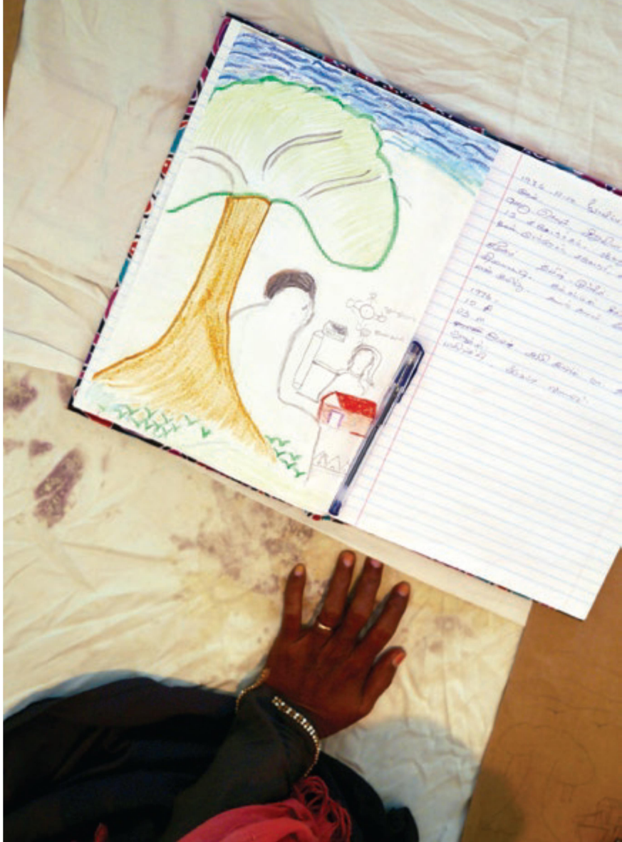
කොළඹ දී 2017 අගෝස්තු මස යුක්තිය, සත්‍යය හා සංහිඳියාව සඳහා මුලපිරීමේ (GIJTR) අනුග්‍රහයෙන් පවත්වන ලද ශරීරය සිතියම්ගත කිරීමේ වැඩමුළුවේදී තමන්ගේ කතන්දරය සටහන් කරන කාන්තාව.

යෝජිත සංක්‍රාන්තික යුක්ති යාන්ත්‍රණයන් පිළිබඳ මහජන අදහස් ලබාගැනීම සඳහා මහජන අදහස් විමසීමේ කාර්ය සාධන බලකාය අග්‍රාමාත්‍යවරයා විසින් 2016 ජනවාරි මාසයේ පිහිටුවන ලදී. අවාසනාවකට මෙන් තම බැඳීම ඉටු කිරීම කැපවීම් පිළිබඳ රජයේ ප්‍රගතිය ඉතා කළකිරීමට තුඩු දෙන ආකාරයෙන් මන්දගාමීව සිදු වී ඇති