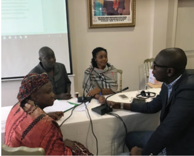
ගයනාවේ 2017 මැයි මස GIJTR සන්ධානය හවුල්කරුවන් විසින් පවත්වන ලද ප්‍රවණත්වය වැළැක්වීමේ වැඩමුළුවක්.