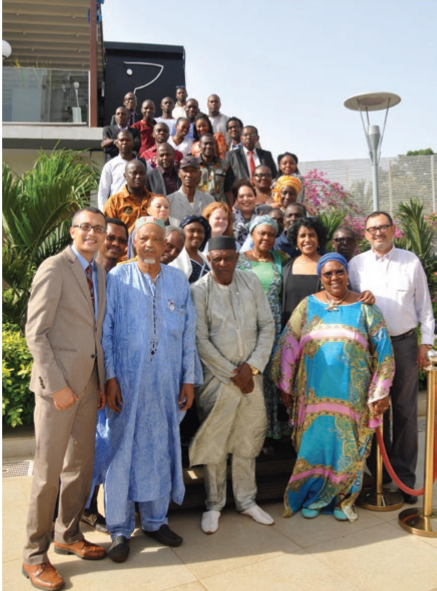
ගිනියාවේ 2017 මැයි මාසයේ GIJTR සංවිධානය විසින් පවත්වන ලද ප්‍රවණ්ඩත්වය වැළැක්වීමේ වැඩමුළුවට සහභාගී වූ සහභාගිවන්හන්