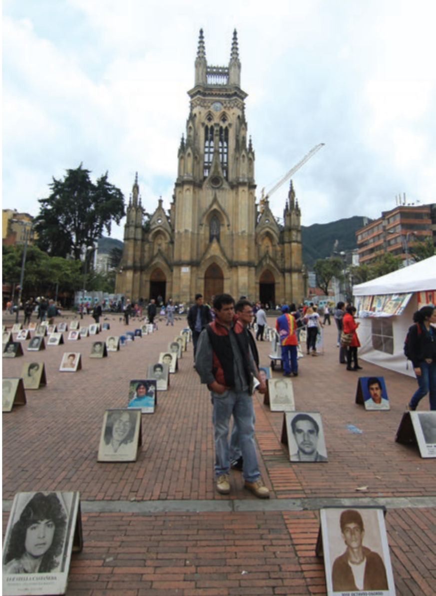
2012 අගෝස්තු මාසයේ අතුරුදහන් වූ හා බලහත්කාරයෙන් අතුරුදහන් කරන ලද පුද්ගලයන්ගේ දිනයේ දී බෝකුටා නගරයේ ලෝපී චතුරසුය