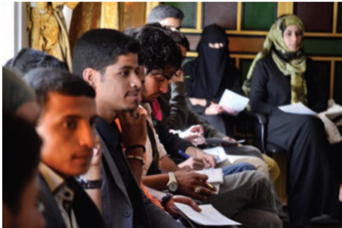
යේමන් රටේ GIJTR සංවිධානයේ උප අරමුදල් සැපයීම මගින් ක්‍රියාත්මක කරන ලද ව්‍යාපෘතියක සහභාගිවන්නන්, නොවැම්බර් 2016.

රැකවරණය පිළිබඳ සැසියන් හරහා දැඩි කම්පනය පිළිබඳ රෝග ලක්ෂණ අධීක්ෂණය කිරීමටත්, තමන්ව හෝ වින්දිතයන් නැවත දැඩි කම්පනයට පත් නොකර, වින්දිතයන් සම්මුඛ සාකච්ඡා කිරීමටත් අවශ්‍ය විධික්‍රමයන් සහභාගිවන්නන් ඉගෙනගන්න. අධ්‍යයන පරිපාදයේ සහභාගිවන්නන් වැඩ කරන ඉතා අනතුරුදායක තත්ත්වයන් හා ඔවුන් ඉහළ මට්ටම්වල ප්‍රවණත්වයට මුහුණදෙන තත්ත්වයන් හේතුවෙන් ස්වයං රැකවරණය පිළිබඳ සැසිය තමන්ගේ මනෝ-සමාජීය අවශ්‍යතාවලට ඉතා වැදගත් ලෙස අදාළ වන ලෙස බොහෝ අය සිතූහ. මීට අමතරව ස්වයං රැකවරණයේ වැදගත්කම නැවත නැවත අවධාරණය කිරීම තමන්ට ඉතා උපකාරී වූ බව බොහෝ සහභාගිවන්නන් සැලකූහ. එයට හේතුව ඔවුන් සහභාගි වී ඇති අනෙකුත් වැඩසටහන් මනෝ-සමාජීය සහයෝගය සඳහා වූ තමන්ගේ පුද්ගලික අවශ්‍යතාවලට ප්‍රමුඛතා ලබානොදීම වේ. පරිපාදය තමන්ගේ න්‍යාය පත්‍රය තුළට දැඩි කම්පනය පිළිබඳ සාකච්ඡා ඇතුළත් කරගැනීම මගින් සංක්‍රාන්තික යුක්තිය වින්දිතයන්ගේ දෘෂ්ටි කෝණයෙන් බැලීමට සහභාගිවන්නන්ට දැනුමක් ලබා දුන්නේය. එය එහි විෂයයාන්තර ප්‍රවේශයේ කාර්ය සාධනීය තත්ත්වය පෙන්වාදෙයි.