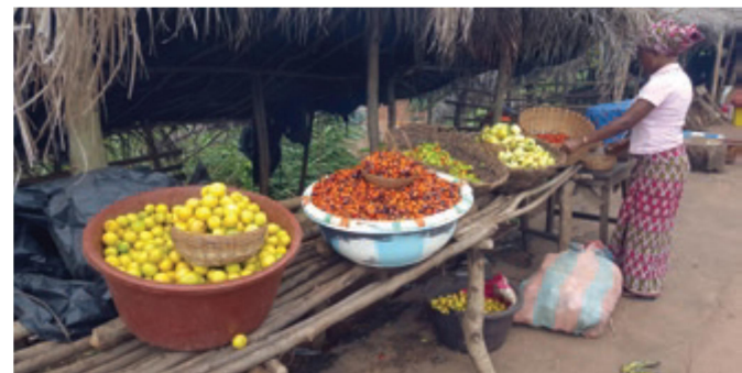
කෝටා ඩී ඉල්වෙයාර් ප්‍රදේශයේ 2017 අගෝස්තු මාසයේ අවශ්‍යතා ඇගයීම සිදු කළ කාලවකවානුවේ මහ මාර්ග දර්ශනයක්

සංක්‍රාන්තික යුක්ති ව්‍යාපෘති විවිධ විෂයන් ඇතුළු ප්‍රවේශයකින් යුතුව ක්‍රියාත්මක කළ යුතුය. ස්වභාවයෙන් සන්ධානය විවිධ ක්ෂේත්‍ර ඇතුළත් සංවිධානයක් වන අතර පුළුල් පරාසයක සංක්‍රාන්තික යුක්තියට සම්බන්ධ හිතිය, ස්ත්‍රී පුරුෂ සමාජභාවය, මානව හිමිකම් ලේඛණගත කිරීම අධිවාචන හා වින්දිතයන්ට මනෝ සාමාජීය සහාය දීම, විද්‍යාත්මක සාක්ෂි විශ්ලේෂණය හා සිවිල් සමාජයේ සංවිධාන ධාරිතාව ගොඩනැගීම වැනි සංක්‍රාන්තික යුක්තියට සම්බන්ධ පුළුල් පරාසයක විෂයන් පිළිබඳව නිපුණතාවයෙන් යුත් සංවිධාන 9 කින් සමන්විත වේ.