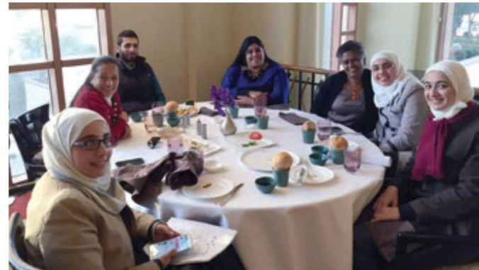
ප්‍රවණ්ඩත්වය හා සංහිඳියා අධ්‍යයනය කේන්ද්‍රයේ සිරියා බ්‍රයිට් ෆිල්ඩ්ස් අම්මාන් සංවිධානය කණ්ඩායම