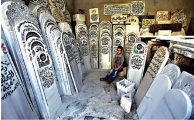
දුමස්කස් නගරයේ සොහොන් බිමක සොහොන් කොත් වටේ වාඩිවී සිටින ළමයෙක් සැප්තැම්බර්, 2015