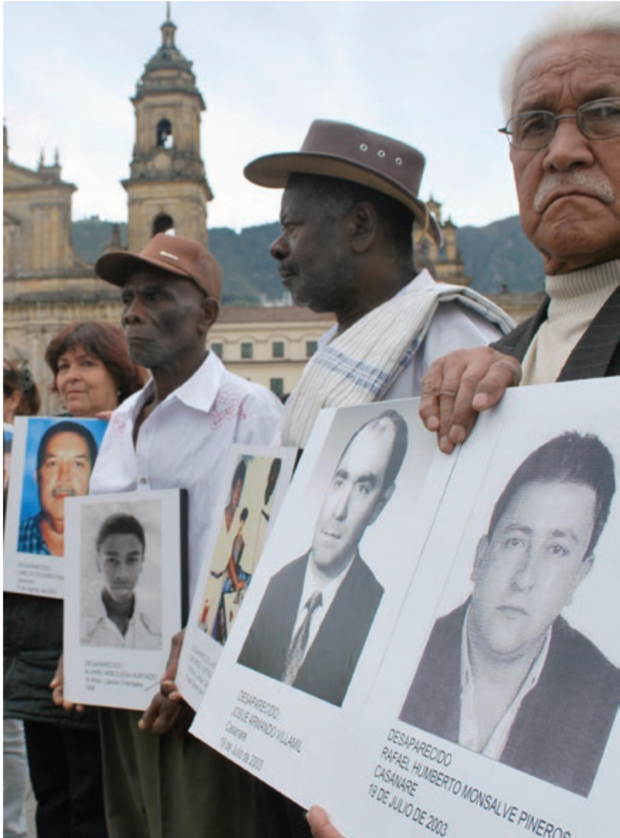
බොගෝටා ප්‍රධාන චතුරස්‍රයේ 2010 අගෝස්තු මාසයේ අතුරුදහන් වූ අතුරුදහන් කරන ලද පුද්ගලයන්ගේ දිනයේ දී අතුරුදහන් වූ තමන්ගේ ආදරණීය හෘදුර්තම භිතවතුන්ට ප්‍රණාම දක්වන ඥාතීන්.