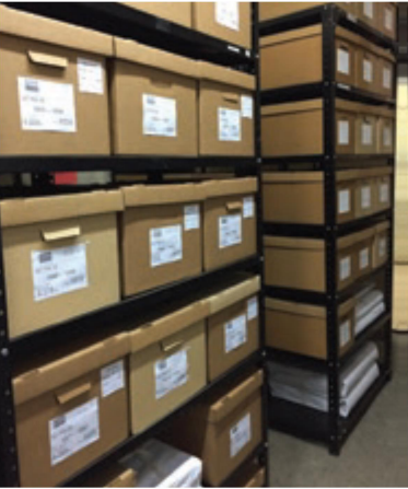
ගෞතමාලා නගරයේ ජාතික ලේඛණාගාරයේ ඩිජිටල් කිරීම සඳහා තැන්පත් කර තිබෙන ලිපි ගොනු

තවද වාචික ඉතිහාස රැස්කිරීම සඳහාමු සන්ධානයේ ක්‍රමවේදය කණ්ඩායම් අතර ප්‍රශ්න අවම කිරීමේ අරමුණින් ප්‍රජාව සමග කටයුතු කිරීම ඉතිහාසය හා සංස්කෘතිය පිළිබඳව විමර්ශන පැවැත්වීම හා සම්බන්ධ විය. සන්ධානයේ හවුල්කරුවන් මෙම ප්‍රවේශය කම්බෝපියාවේ සිදුකරන මානව හිමිකම් ලේඛණාගත කිරීමේ මූලපිරීම අන්දැකිම් හුවමාරු වැඩසටහනේදී මෙම ප්‍රවේශය ප්‍රජාව එක්කළ හැක්කේ කෙසේදැයි යන කරුණා පෙන්වා දුන්හ. මෙම කම්බෝපියාවේ පවත්වන ලද වැඩසටහනේ සිවිල් සමාජ සංවිධාන ගැටුමට පෙර ඉතිහාසය හා සමූල ඝාතන ඉතිහාසය සදානුස්මරණය හා අධ්‍යාපන කටයුතුවලට ඒකාබද්ධ කරන්නේ කෙසේදැයි යන්න පිළිබඳ උදාහරණ ලබා දුන්හ. තවද කම්බෝපියානු සිවිල් සමාජ සංවිධාන වාචික ඉතිහාස රැස් කිරීම, ගබඩා කිරීම ලේඛණාරක්ෂක ලේඛණාගාර සංවර්ධනය කිරීම රැස් කරන ලද ලේඛණ පාවිච්චි කරන ප්‍රසිද්ධ වැඩසටහන් දුෂ්කර පළාත්වල ප්‍රජාව හා සමග කටයුතු කිරීම යන කරුණු සඳහාමු යහපර්වයන්ද බෙදා හදා ගත්හ. වාචික ඉතිහාසයන් දකුණු සුඩාන ජනතාවගේ සාමූහික මතකය සඳහාමු වැදගත් පියවරක් වශයෙන් තිබෙන නිසා ගටුමට අදාළ දුක් ගැනවිලි හා ප්‍රශ්න ඉස්මතු කිරීමට ඒවා පාවිච්චි කළ හැකිය.