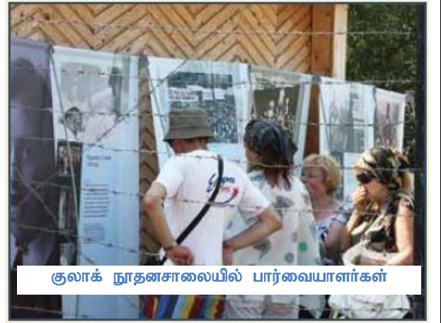
குலாக் நூதனசாலையில் பார்வையாளர்கள்

சோவியத் ஆட்சியாளர்களின் 70 ஆண்டு கால நிர்வாகத்தின் பின்பு 1980 களின் இறுதிப் பகுதியில் சோசலிச ஆட்சி முடிவடைகிறது. அதுவரையில் மாற்று அரசியல் கருத்துக் கொண்டவர்கள் குற்றவாளிகளாகக் கருதப்பட்டனர். மாற்றுக் கருத்துக் கொண்டிருந்தவர்கள் 1930 களில் ஸ்டாலின் ஆட்சியில் தண்டிக்கப்பட்டார்கள். அவர்கள் கட்டாய வேலை (Forced-Labor) முகாம்களில் அமர்த்தப்பட்டனர். நாட்டின் பொருளாதர வளத்தை பெருக்க மாற்று கருத்துடையவர்கள் இவ்வாறு வேலைக்கு அமர்த்தப்பட்டார்கள். இம்முறை “குலாக்” என அழைக்கப்பட்டது.