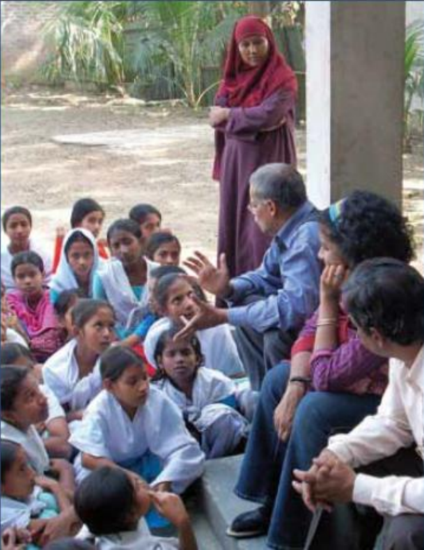
டாக்கா புறநகர் பகுதியில் இடம்பெறும் விடுதலைப் போர் அருங்காட்சியகத்தின் ஓர் கல்வி நிகழ்ச்சித்திட்டம்

அதே நேரத்தில் மதச் சார்பற்ற, ஜனநாயக கொள்கைகளை அடிப்படையாக கொண்ட விடுதலைப் போரின் அடிப்படை விழுமியங்கள் வரலாற்று நிகழ்வுகளை ஒன்றிணைக்கும் பொது இழையாக இருந்து வந்தது. இந்த அணுகுமுறை மூலம் இக்காட்சியகம் அனைத்து விதமான அரசியல் நிலைப்பாடுகளையும் கொண்டிருக்கும் மக்களை கவரக் கூடியதாக இருந்து வருவதுடன், மக்களின் நம்பிக்கையையும் வென்றெடுக்கக் கூடியதாக உள்ளது. சமூகத்தினர் முனைப்பான விதத்தில் பங்கேற்கக் கூடிய மேலதிக நிகழ்ச்சித்திட்டங்களை அபிவிருத்தி செய்வதற்கும் இது இந்த அருங்காட்சியகத்தை தூண்டியுள்ளது.