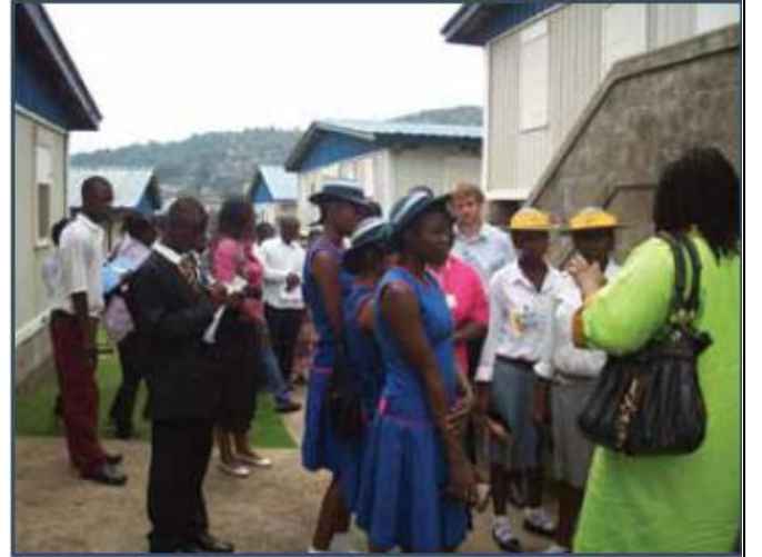
சியரா லியோன் சிறப்பு நீதிமன்றத்தில் நீதி, மன்னிப்பு மற்றும் நல்லிணக்கம் போன்ற பிரச்சினைகள் குறித்து கலந்துரையாடும் பார்வையாளர்கள்.

சியரா லியோனில் 1991 ஆம் ஆண்டு புரட்சிகர ஐக்கிய முன்னணி (Revolutionary United Front) அரசியல் சதியொன்றில் ஈடுபட்டது. இதனால் பதினொரு வருடங்கள் அந்நாட்டில் கொடிய உள்நாட்டுப் போர் நடைபெற்றது. மோதல்களை தடுப்பதற்கான பலவித உள்நாட்டு, பிராந்திய, சர்வதேச முயற்சிகள் 1996 – 1999 காலப் பிரிவில் முன்னெடுக்கப்பட்டன. 2002ம் ஆண்டு போர் முடிவுற்றதாக அதிகாரபூர்வமாக அறிவிக்கப்பட்டது. சியராலியோனின்