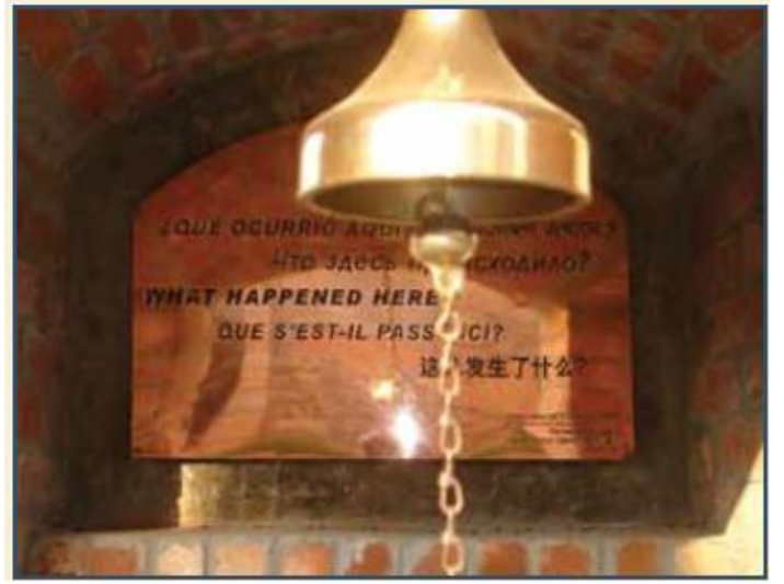
கொலைக் களங்களின் நினைவிடத்தில் பொறிக்கப்பட்டுள்ள வாசகம் “இங்கு என்ன நடந்தது” என ஆறு மொழிகளில் கேட்கிறது.

பங்களாதேஷ், 1971 டிசம்பரில் ஒரு சுதந்திர அரசாக மாறியது. பாகிஸ்தான் இராணுவ ஆட்சிக் குழு ஜனநாயக தேர்தல் தீர்ப்பை மறுத்தமையை தொடர்ந்து ஒன்பது மாதம் இடம்பெற்ற இரத்தம் தோய்ந்த போரின் பிறகு அது ஒரு சுதந்திர அரசாக மாறியது. மேற்கு பாகிஸ்தானிய இராணுவ ஆட்சியாளர்கள் வங்காள மக்களின் தேசிய மற்றும் ஜனநாயக உரிமைகளுக்கான போராட்டத்துக்கு ஒரு “இறுதித் தீர்வை”