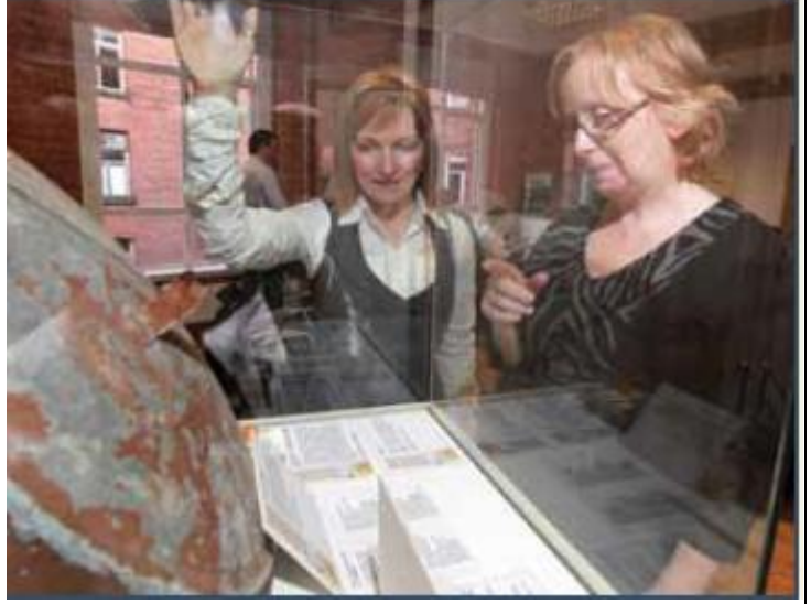
நினைவுபடுத்தலுக்கூடாக காயங்களை ஆற்றும் அமைப்பு ஏற்பாடு செய்திருந்த "மோதலுக்கூடாக நிலைமாற்றம் செய்யப்பட்டிருக்கும் நாளாந்த பொருட்கள்" கண்காட்சி

கேள்விகளின் அடிப்படையிலேயே இது நிகழ்ந்தது. மேலும், இந்த மோதல் சமய அடிப்படையிலான பிரிவினையையும் சாதகமாக கொண்டு இடம்பெற்று வந்துள்ளது. புரட்டஸ்தாந்து யூனியன் வட அயர்லாந்தில் பிரிட்டிஷ் ஆட்சிக்கு ஆதரவாக இருந்து வருவதுடன், பெருமளவுக்கு கத்தோலிக்க தேசியவாத சமூகத்தினர் சுதந்திர அயர்லாந்தை ஆதரித்தனர். இந்தக் 'குழப்பங்கள்' 1960 கள் தொடக்கம் 1998 வரையில் இடம்பெற்று வந்ததுடன், பெல்பாஸ்ட் பெரிய வெள்ளிக்கிழமை உடன்படிக்கையைடுத்து முடிவுக்கு வந்தன. இந்த சமாதான உடன்படிக்கை துணைப் படைகளினால் பிரகடனப்படுத்தப்பட்ட போர் நிறுத்தம், அயர்லாந்து விடுதலை இராணுவத்தின் ஆயுதங்கள் களையப்படுதல், பொலிஸ் துறை சீர்த்திருத்தம், பெல்பாஸ்ட் வீதிகளிலிருந்து பிரிட்டிஷ் துருப்புக்களை விலக்கிக் கொள்ளல் என்பவற்றை உள்ளடக்கியிருந்தது. இந்த சமாதான ஒப்பந்தம் உத்தியோகபூர்வமாக குழப்பங்களின் முடிவை குறித்துக் காட்டிய அதே வேளையில், யதார்த்தம் என்னவென்றால் 2011 ஆம் ஆண்டு வரையிலும் கூட உள்ளூர் சமூகங்களில் தொடர்ந்தும் வன்முறைச் சம்பவங்கள் இடம்பெற்று வந்துள்ளன என்பதாகும். அயர்லாந்து பிரச்சினை சார்புரீதியில் குறைந்த எண்ணிக்கையிலான முனைப்பான போராளிகள் சம்பந்தப்பட்ட ஒரு பிரச்சினையாக இருந்து வந்த போதிலும், 1960 க்கும் 2001 க்கும் இடைப்பட்ட காலத்தில் இதன் விளைவாக 3,526 பேர் கொல்லப்பட்டதுடன், சாதாரண பிரஜைகளின் அன்றாட வாழ்க்கையும் அச்சுறுத்தல்களை எதிர் கொண்டிருந்தது. நான்கு தசாப்த காலம் இரண்டு தலைமுறைகளைப் பாதித்த வன்முறையைச் சந்தித்திருக்கும் ஒரு சமூகம் அதன் கடந்த காலத்தை எதிர்கொள்வது எப்படி? ஆழமாக பிளவுண்டிருக்கும் ஒரு