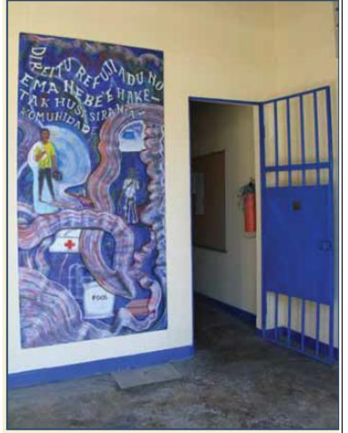
கொமர்கா பிலைட் சிறைச்சாலை அறைகளுக்கு வெளியில் பொது மக்களால் தீட்டப்பட்ட சித்திரம்.

கிழக்கு திமோர் 1642 ஆம் ஆண்டு போர்த்துகேயரின் காலனித்துவ நாடாக மாற்றப்பட்டது. 1975 ஆம் ஆண்டு அது சுதந்திரம் அடைந்தது. ஒழுங்குமுறையற்ற முறையில் முன்னெடுக்கப்பட்ட காலனித்துவ கூறுகளை நீக்கும் செயன்முறை அரசியல் அதிகாரத்துக்கான போட்டிகளை எடுத்து வந்தது. இந்தோனேஷிய தலையீடு நிலைமையை மேலும் மோசமாக்கியது. 1974 ஆம் ஆண்டு டிசம்பர் மாதம் டிமோர் - லெஸ்தே மீது இந்தோனேஷியா தாக்குதல் தொடுத்தது. உள்நாட்டுப் போர் நடைபெறாமல் இருப்பதற்காகவும், கம்யூனிஸ்ட் அதிகாரத்தை தடுப்பதற்கும் இவ்வாறு செய்ததாக இந்தோனேஷியா கூறியது. ஐக்கிய நாடுகள் பாதுகாப்புப் பேரவை இந்தோனேஷிய இராணுவத்தை வெளியேறும்படி கேட்டுக் கொண்டது. இந்தோனேஷிய இராணுவம் சட்டவிரோதமாக