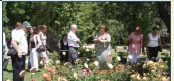
இந்த இடத்தில் அடைத்து வைக்கப்பட்டிருந்த பெண்களின் நினைவுக்கு அர்ப்பணிக்கப்பட்டிருக்கும் ரோஜாப்பூ தோட்டம்

1973 ஆம் ஆண்டு செப்டெம்பர் மாதம் சிலியில் இடம்பெற்ற ஒரு இராணுவப் புரட்சி ஜனாதிபதி சல்வடோர் அலெண்டேவின் அரசாங்கத்தை முடிவுக்கு கொண்டு வந்து, வலதுசாரி இராணுவ ஆட்சியொன்றை சிலியில் ஸ்தாபித்தது. நாடெங்கிலும் இருந்து வந்த ஜனநாயக நிறுவனங்கள் மூடப்பட்டதுடன், அவற்றுக்குப் பதிலாக மிகவும் கொடுமான இராணுவ சர்வாதிகார ஆட்சி நிறுவப்பட்டது. ஒரு அடக்குமுறை செயற்பாடு துவக்கி வைக்கப்பட்டதுடன், அரசின் எதிரிகள் முறையான ஒழுங்கில் ஒழித்துக்கட்டப்பட்டார்கள். ஆயிரக்கணக்கான பிரஜைகள் தடுத்து வைக்கப்பட்டதுடன், “காணாமல் போனார்கள்”. ஏனையவர்கள் தடுப்பு முகாம்களிலும், சித்திரவதை முகாம்களிலும் 17 வருட அரசு பயங்கரவாத கால கட்டத்தின் போது துன்பங்களை அனுபவித்தார்கள். அத்தகைய இடங்களில் ஒன்று கிரிமால்டி தோட்டமாகும். சன்டியாகோ புறநகர் பகுதியில் செல்வந்த குடும்பமொன்றுக்குச் சொந்தமான இடமே கிரிமால்டி தோட்டமாகும். அது உயர்ந்த கற் சுவர்களினால் மூடுண்டு இருந்ததுடன், பல்வேறு அளவுகளைக் கொண்ட பல்வேறு கட்டடங்களை கொண்டிருந்தது.